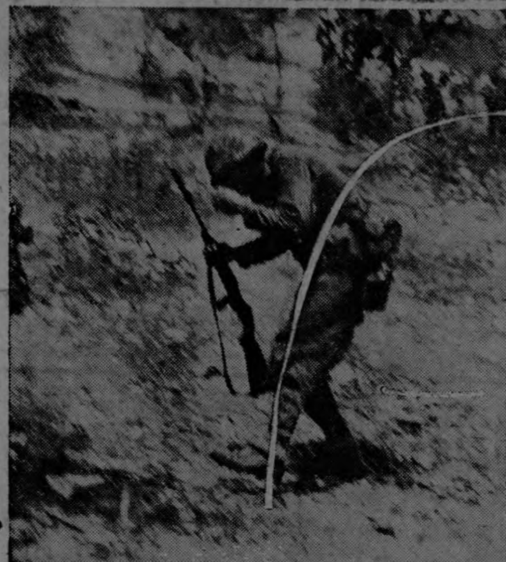
Extraordinaria fotografía mostrando un soldado de infantería de marina de los Estados Unidos en el momento de caer herido por los cascos de una granada japonesa durante el ataque a una posición enemiga en la isla de Saipán, en el Pacífico central.